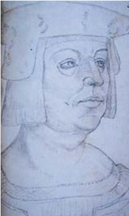
Portret Filips van Bourgondië. (In Recueil d'Arras)