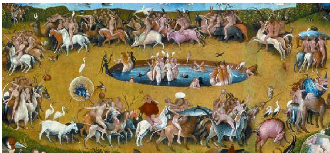
Jheronimus Bosch, De Tuin der Lusten (Madrid, Prado), detail van het middenpaneel (de ruiterskring).